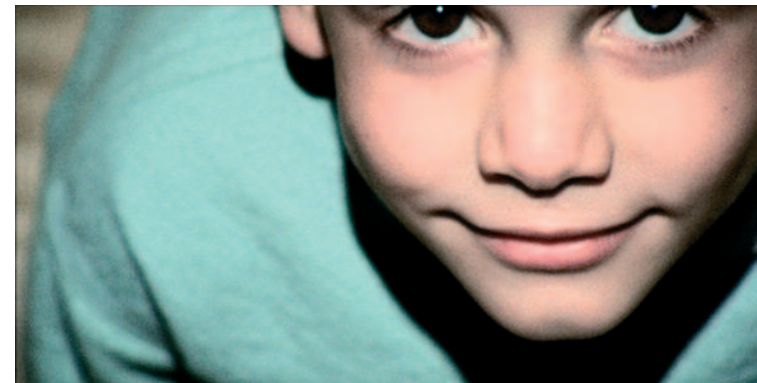
VIDÉO MARIA MARSHALL, COLLECTION FRAC - PROVENCE ALPES CÔTE D'AZUR

Un éveil du regard en forme de clin d'œil qui décale et enrichit la perception que l'on peut avoir d'un spectacle.